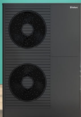
aroTHERM plus 12 et 15