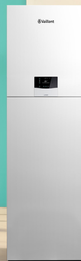
Colonne double service uniTOWER

Régulation radio ou filaire sensoCOMFORT