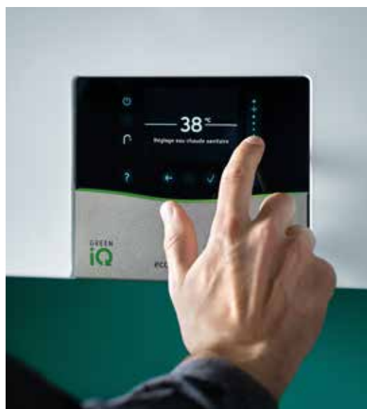
ecoTEC exclusive avec l'interface Sensitive Touch

Cette prouesse technologique permet de réduire la consommation de gaz et l'impact écologique du produit.