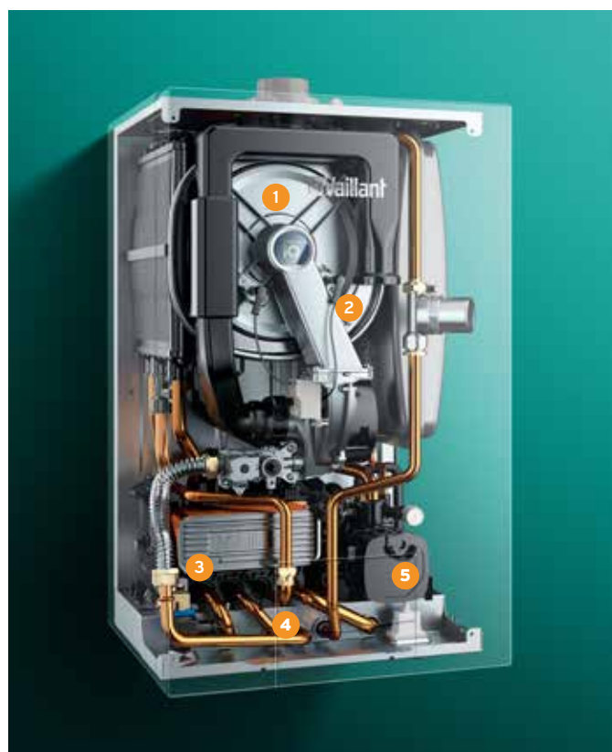
ecoTEC exclusive, vue intérieure aux rayons X.