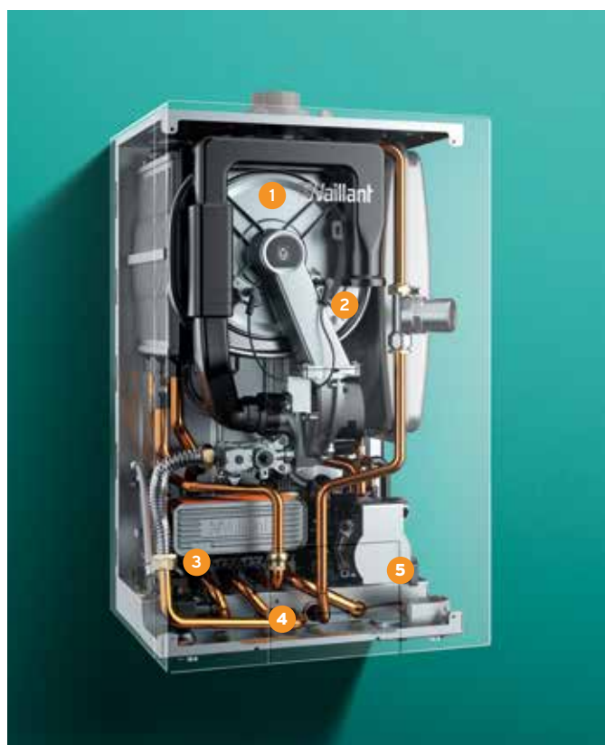
ecoTEC plus extraCONDENS, vue intérieure aux rayons X.