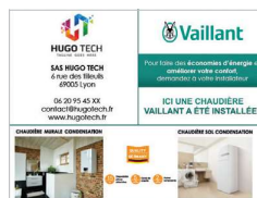
Panneaux de chantier