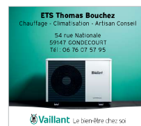
Plaques magnétiques pour voiture